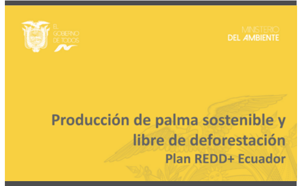
Palma Aceitera Libre de Deforestación Steven Pedersen Ministerio del Ambiente Ecuador