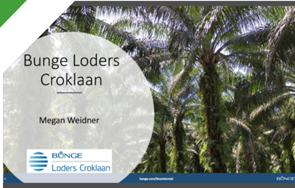
Bunge Loders Croklaan Megan Weidner Bunge