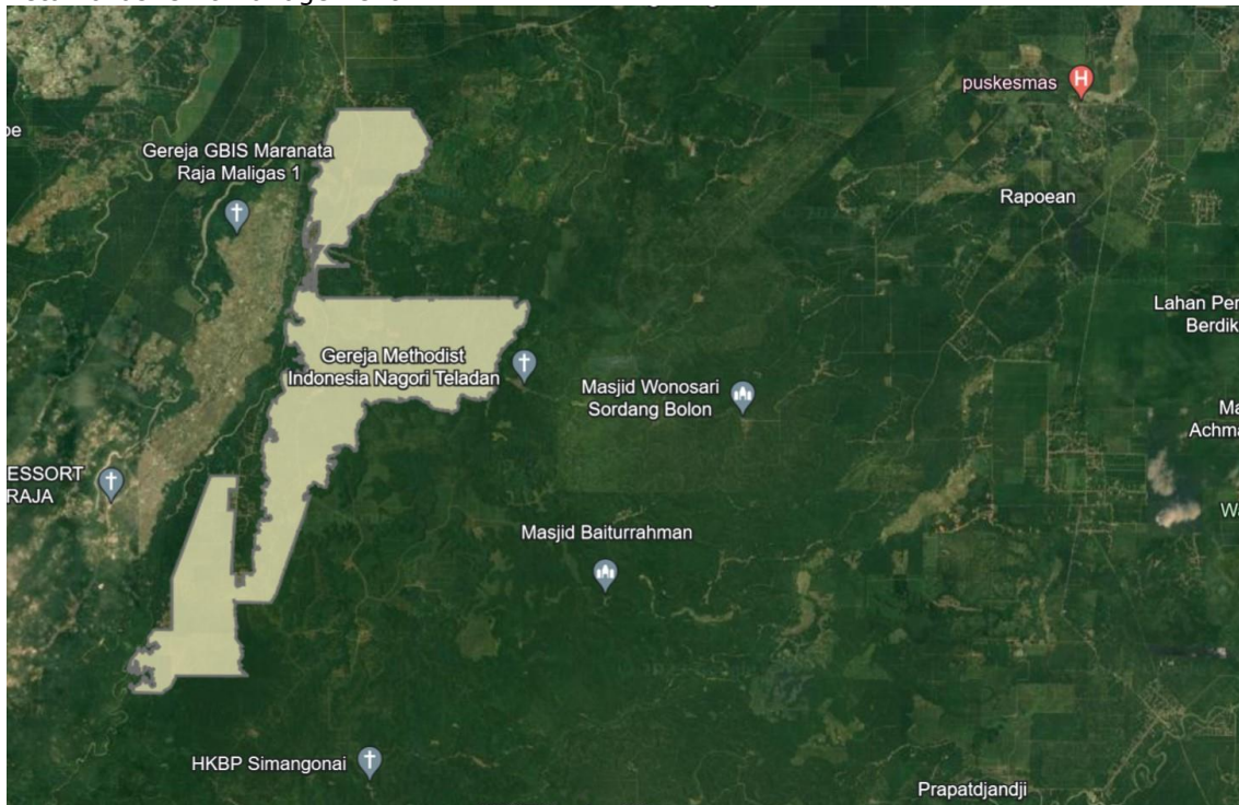
Peta Lokasi Mayang