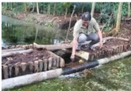
Figure 2 : Exemple de « embung » à Kubu Raya, Kalimantan Barat

Une structure simple « embung » de 4 m de largeur x 6 m de longueur x 3 m de profondeur peut être facilement réalisée en agriculteurs dans leur ferme. Il peut être construit à l'aide de main-d'œuvre manuelle et la durée de la construction dépend de l'état de la tourbe. Pour les dimensions indiquées ci-dessus, cela peut prendre 15 jours, si le processus de creusement implique une extraction lourde de masse racinaire massive.