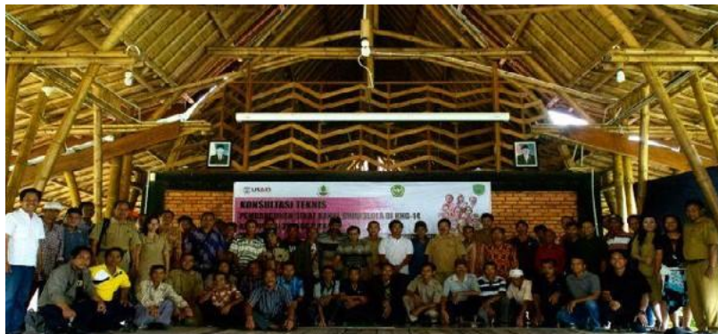
Figura 3 : Participación d la comunidad en la restauración de turberas: CLPI

LESTARI proporcionó apoyo técnico y financiero para el proceso de CLPI con mediación del foro de múltiples partes interesadas a nivel de distrito. Se hizo uso de las directrices sobre salvaguardas sociales de USAID y BRG para el CLPI.