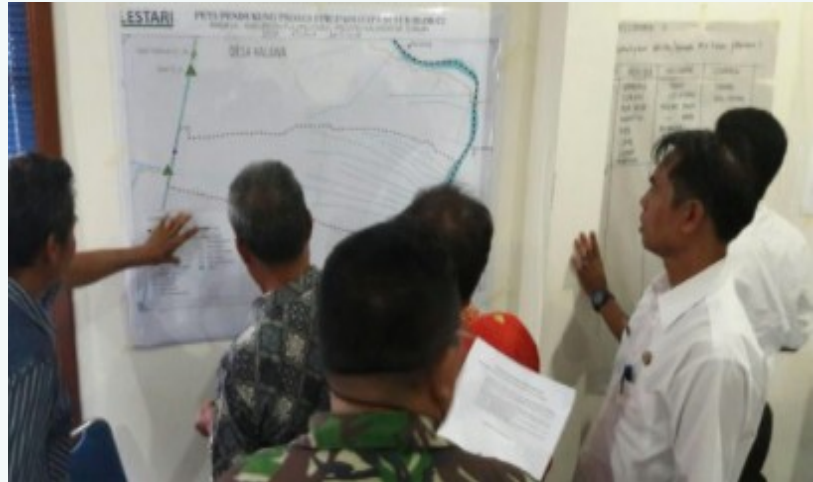
Figura 4: Se informa a los partes interesados en el CLPI sobre los planes de bloqueo del canal

De cara al futuro, el BRG ha dejado claro que cualquier parte que lleve a cabo el bloqueo de canales en la zona debe estar sujeta a los compromisos de CLPI. Con el fin de institucionalizar el enfoque y promover su sostenibilidad, LESTARI obtuvo el acuerdo de que el CLPI se convirtiera en un procedimiento operativo estándar para el diseño y la implementación de los bloqueos de canales en las directrices de Obras Públicas. El jefe del BRG también ha decidido que el proceso de CLPI apoyado por LESTARI servirá de modelo para una planificación del uso de la tierra más sostenible e inclusiva en Sumatra.