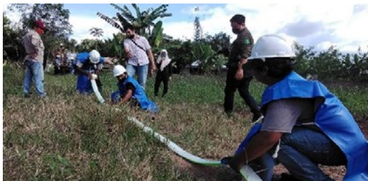
Figura 1: PT Sawit Sumbermas Sarana Tbk (SSMS) ayudó a un grupo de pequeños productores certificados por la RSPO en Kalimantan Central con el monitoreo en focos habituales de incendios

La prohibición de los incendios para el despeje es un criterio clave del Estándar RSPO para Pequeños Productores Independientes adoptado en noviembre de 2019. Uno de los grupos certificados por la RSPO en Kalimantan Central, Asosiasi Petani Kelapa Sawit Mandiri, es consciente de que los incendios pueden propagarse rápidamente a otros lugares, especialmente cerca de turberas inflamables; por lo tanto, en un esfuerzo por mitigar los incendios durante la estación seca, el grupo contó con la ayuda del miembro de la RSPO de productores, PT Sawit Sumbermas Sarana Tbk (SSMS), para establecer una unidad de prevención de incendios e impartir formación sobre la detección de incendios en los focos habituales mediante una aplicación Android. Los focos de incendios se pueden monitorear fácilmente a través de la brújula digital y el mapa integrados en los teléfonos inteligentes.