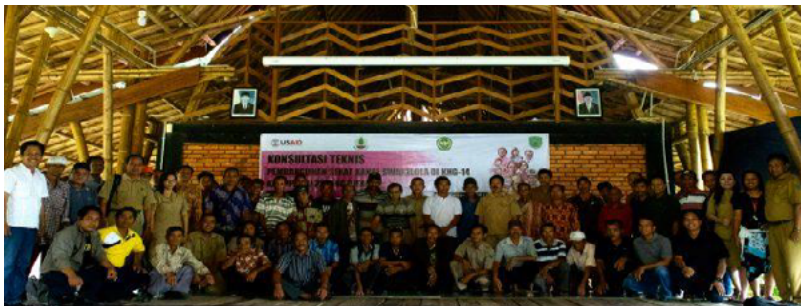
Gambar 27: Pelibatan masyarakat di restorasi lahan gambut: FPIC

Untuk mendukung inisiatif ini, USAID LESTARI baru-baru ini menyelesaikan model kegiatan pelibatan pemangku kepentingan dengan memfasilitasi FPIC di desa-desa yang mencakup sekitar 30.000 ha lahan gambut terdegradasi. Lahan gambut ini merupakan bagian dari kawasan yang mencakup kurang dari 5% dari seluruh wilayah provinsi, tetapi menyumbang 30% dari semua dampak kebakaran di tahun 2015. Fasilitasi FPIC memastikan bahwa masyarakat mendapatkan informasi tentang penyekatan kanal, berkesempatan memberikan masukan, dan memberikan persetujuannya untuk membangun, memelihara, dan melindungi bendungan. Masyarakat setempat khususnya dapat memengaruhi rancangan bendungan agar perahu/kapal kecil mereka dapat melewati saluran pelimpah untuk mempertahankan mata pencahariannya. LESTARI memberikan dukungan teknis dan finansial terhadap proses FPIC yang dimediasi oleh forum multipemangku kepentingan di tingkat kabupaten. Dukungan ini diberikan dengan mematuhi panduan perlindungan sosial untuk FPIC.