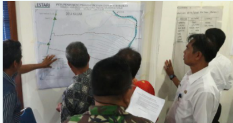
Gambar 28: Pemangku kepentingan FPIC diberikan informasi mengenai rencana penyekatan kanal

Selain itu, BRG juga telah menegaskan bahwa setiap pihak yang melakukan penyekatan kanal harus tunduk pada komitmen FPIC. Guna meresmikan pendekatan dan mendukung keberlanjutannya, LESTARI mendapatkan persetujuan bahwa FPIC akan menjadi Standar Operasi Prosedur (SOP) dalam perancangan dan pelaksanaan penyekatan kanal pada panduan Pekerjaan Umum. Kepala BRG juga telah memutuskan bahwa FPIC yang didukung LESTARI akan menjadi model perencanaan pemanfaatan lahan di Sumatera.