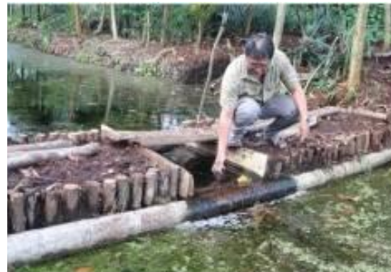
Gambar 26: Contoh embung yang dibuat di Kubu Raya, Kalimantan Barat.

Struktur 'embung' sederhana berukuran 4 m x 6 meter x kedalaman 3 meter dapat dibangun oleh petani di perkebunannya. Konstruksinya dapat dibangun secara manual dan bergotong royong, dan durasi konstruksi bergantung pada kondisi lahan gambut. Untuk membangun embung dengan dimensi sederhana ini diperlukan waktu selama 15 hari, jika proses penggalian melibatkan ekstraksi massa akar yang besar.