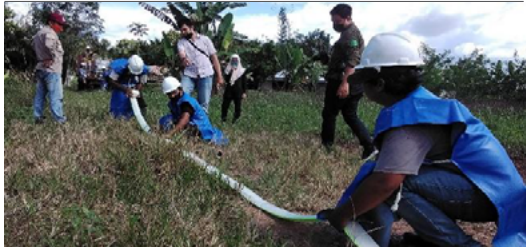
Gambar 25: Kelompok Petani Bersertifikat RSPO di Kalimantan Tengah dibantu PT Sawit Sumbermas Sarana Tbk (SSMS) dalam melakukan pemantauan titik kebakaran

Larangan penggunaan api untuk penyiapan lahan merupakan kriteria penting dalam Standar Petani Swadaya RSPO yang diadopsi pada bulan November 2019. Salah satu kelompok bersertifikat di Kalimantan Tengah, Asosiasi Petani Kelapa Sawit Mandiri telah menyadari bahwa kebakaran di satu tempat dapat menyebar ke tempat lain dengan cepat, terutama lokasi yang berdekatan dengan lahan gambut yang terbakar. Dalam upaya memitigasi musim kemarau dan kebakaran lahan, rombongan didampingi oleh petani anggota RSPO yaitu PT Sawit Sumbermas Sarana Tbk (SSMS) membentuk unit pencegahan kebakaran dan pelatihan mengenai deteksi titik api (hotspot) melalui aplikasi android. Titik api dapat dengan mudah dipantau melalui kompas dan peta digital yang tertanam di telepon.