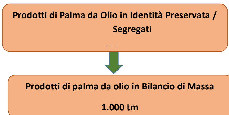
Figura 1: Conversione 1 a 1 IP/SG a MB