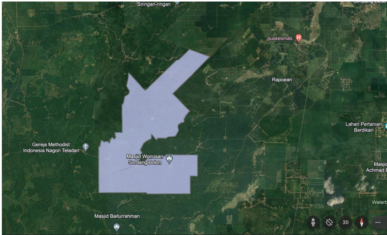
Peta Lokasi Kebun Padang Matinggi