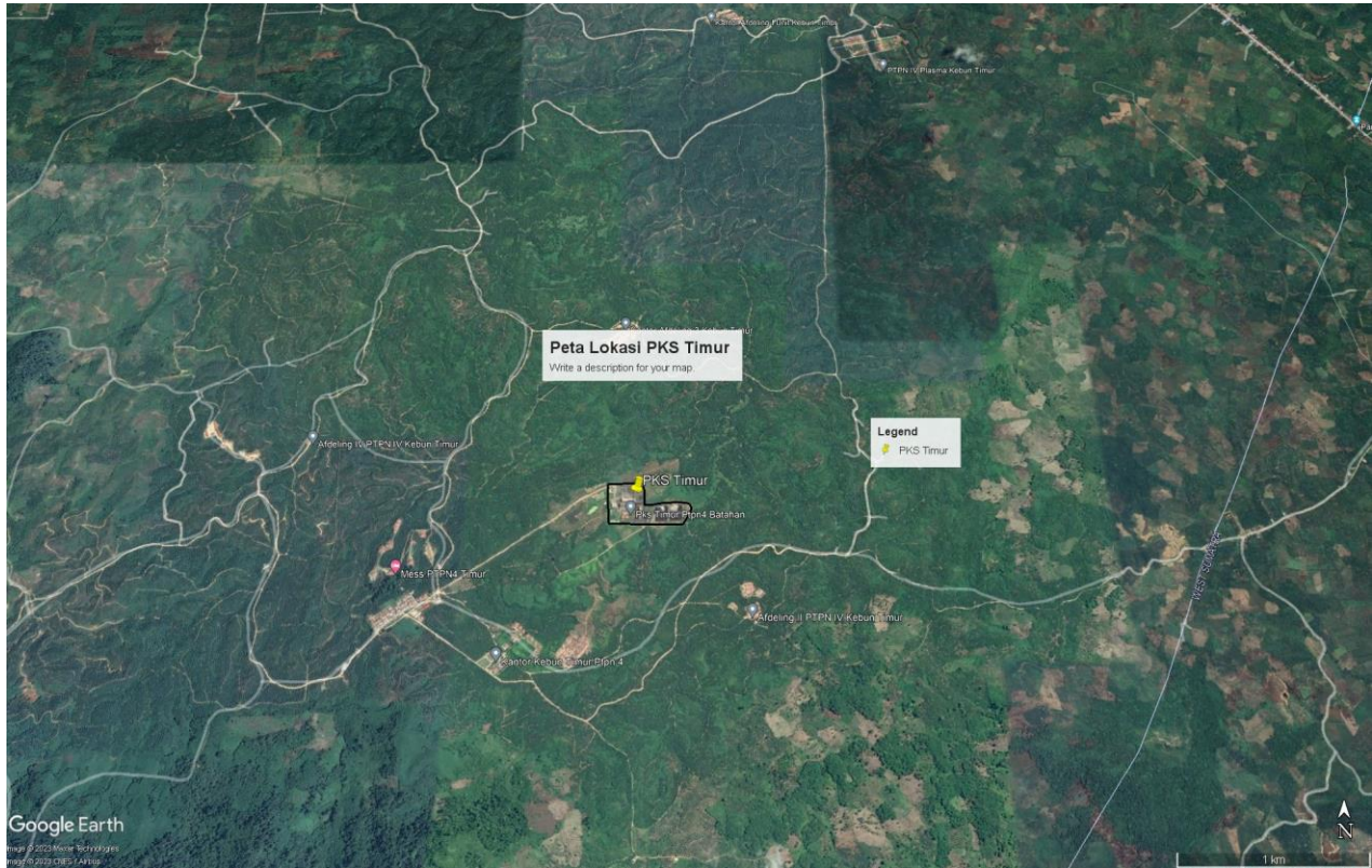
Peta Lokasi PKS Timur